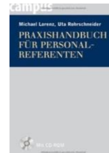
Praxishandbuch für Personalreferenten