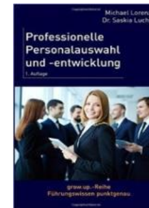
Professionelle Personalauswahl und - entwicklung