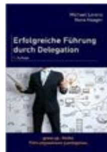
Erfolgreiche Führung durch Delegation