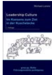
Leadership Culture. Im Konsens zum Ziel in der Kuschelecke