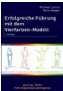
Erfolgreiche Führung mit dem Vierfarben-Modell