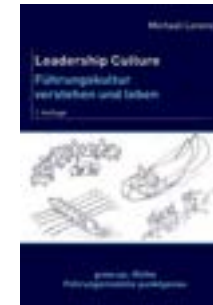
Leadership Culture. Führungskultur verstehen und leben