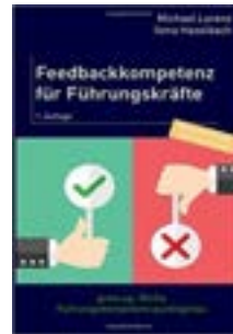
Feedbackkompetenz für Führungskräfte