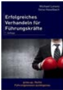
Erfolgreiches Verhandeln für Führungskräfte