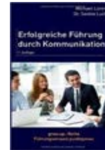
Erfolgreiche Führung durch Kommunikation